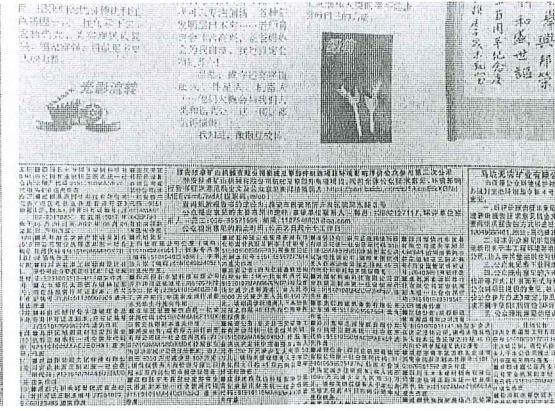
图 4 登报 2021 年 7 月 27 日登报截图