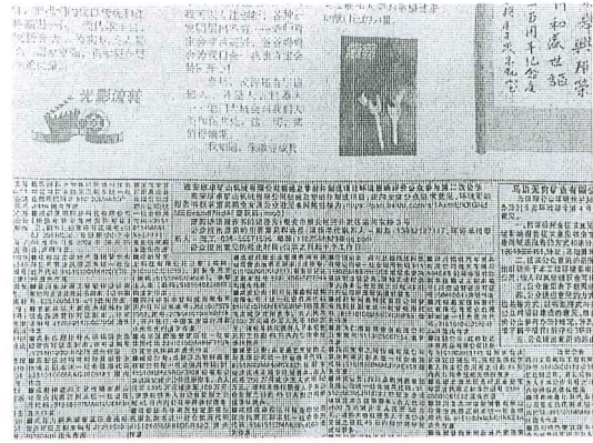
图 3 登报 2021 年 7 月 22 日截图