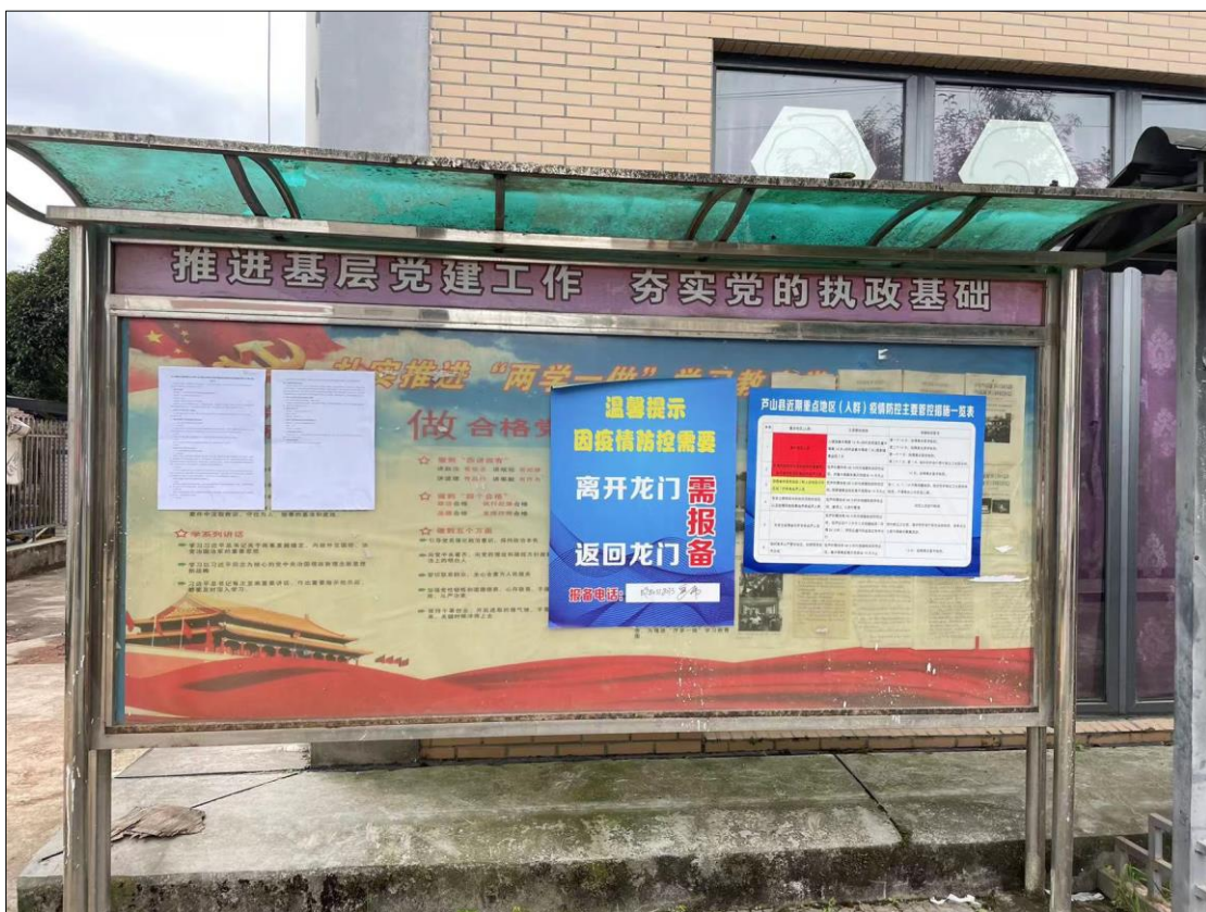
图 3-6 现场公告照片 3