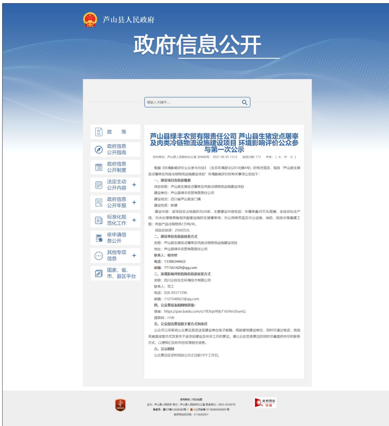
附图 2-1 第一次公示截图