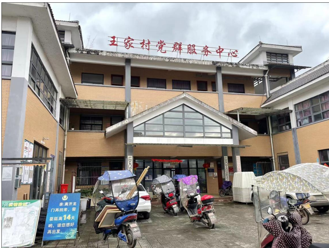
图 3-5 现场公告照片 2