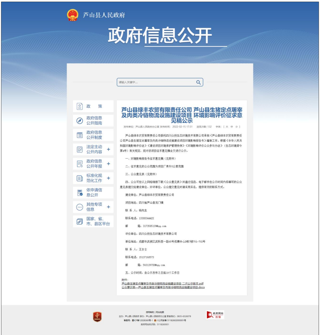
附图 3-1 第二次公示截图