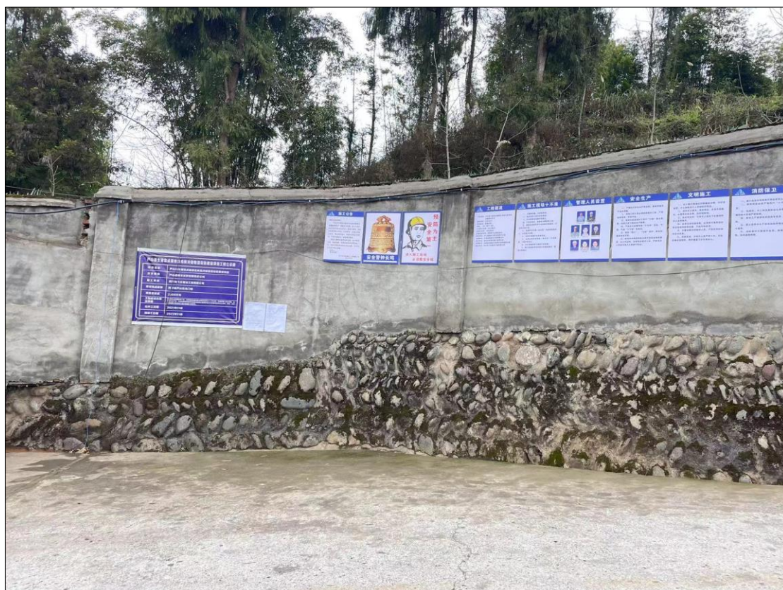
图 3-4 现场公告照片 1